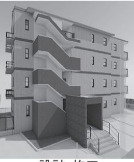
—設計・施工— (株)花田工務店

名古屋市中区駈上二丁目にて、株式会社花田工務店が設計・施工を手掛けるオーナールーム付き共同住宅が2025年12月に完成の予定をしております。当物件のオーナー様は関係親族を含めると、花田工務店で手掛ける4棟目の物件となります。 当物件は、1フロア1戸で建物の四面全てから採光がとれる間取りとなっております。居室面積は90㎡を超える3SLDKとなっております。各居室は充実した広さがあり、各居室などに収納スペースが設けられていますので、減多に味わうことができます。 また、当物件は名古屋市内地下鉄新瑞橋駅から徒歩6分のところに位置し、徒歩3分のところにイオンモール新瑞橋があり、外部環境も充実しております。ファミリー物件で問題視されやすい駐車場台数は敷地内に各戸2台分ありクリアしています。 入居者様に長く快適にお住まいしてほしいというオーナー様の想いを実現するため、花田工務店では完成後のアフターフォローまで手厚く対応いたします。